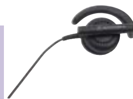
BDN6720 – Головной телефон с жесткими ободами

16-канальная радиостанция CP140 — отличный выбор для работников небольших организаций, которым необходима постоянная и экономичная связь с коллегами и руководством. Пользователи могут переключаться на дополнительный канал, чтобы обсуждать более сложные вопросы один на один.