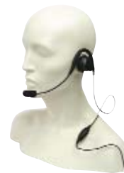
RMN5015 — Сверхпрочная гарнитура (требует кабеля–адаптера гарнитуры RKN4090)