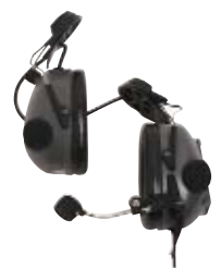
RMN4053 – Жесткая гарнитура, устанавливающаяся на головной убор, с защитой ушей (серая)